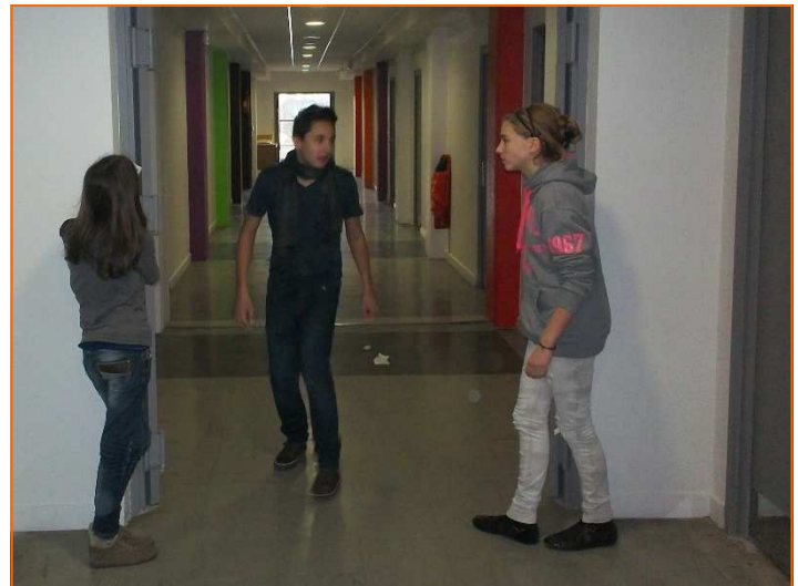
Travail de mise en scène...