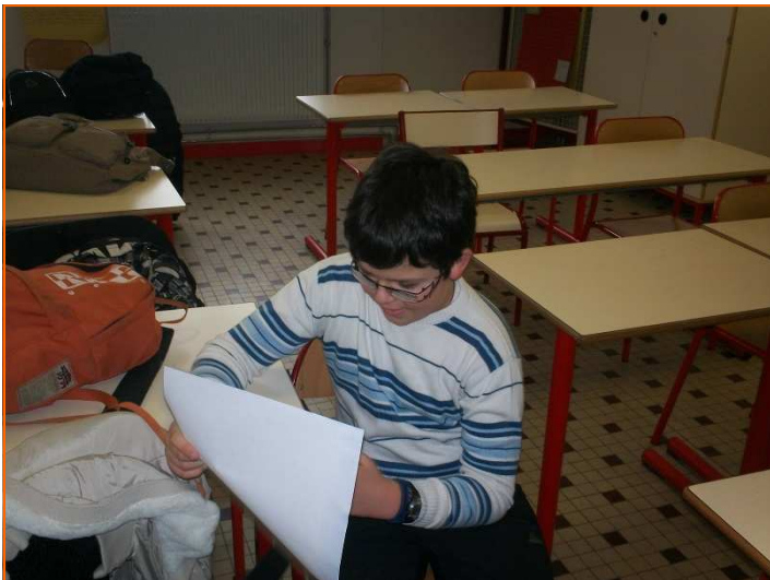
Apprentissage de son texte