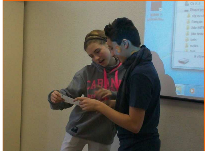
Lecture des scènes