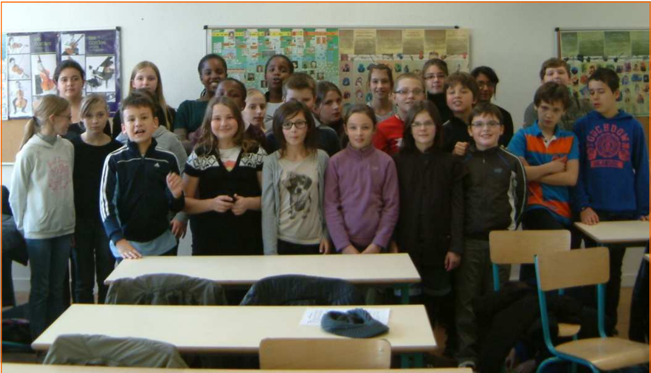
Groupe vocal du collège A. Terroir de Marly