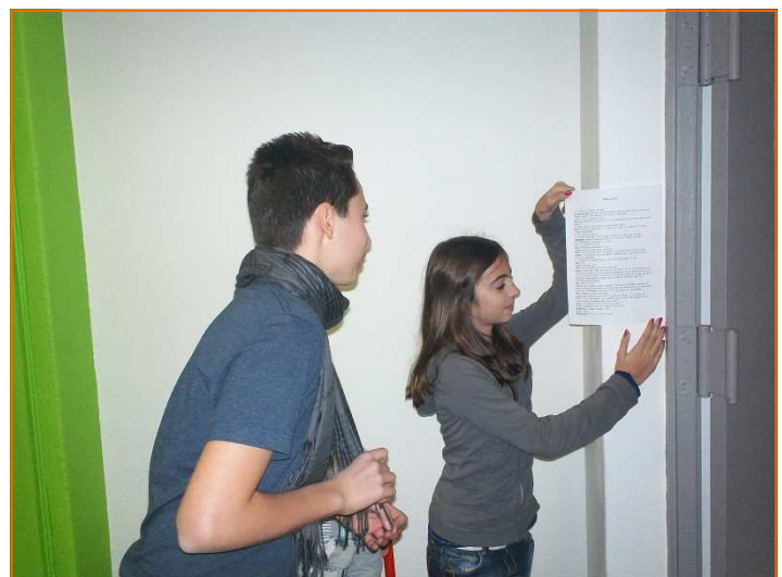
...aidés par la souffleuse